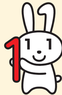
マイナンバー 広報キャラクター マイナちゃん

納税や社会保険などの各種の行政事務で個人を特定するために使われます。番号は原則として一生変わりません。住民票のある市(区)町村から届く「通知カード」に記載されています。